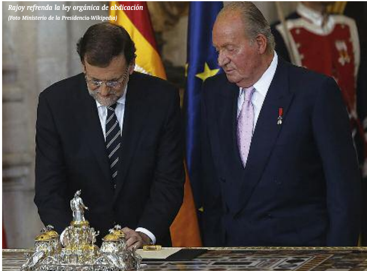
Rajoy refrenda la ley orgánica de abdicación

No soy neofascista, como dicen algunos, soy liberal mal que les pese a otros, y tengo una experiencia de la democracia a mis 77 años y tras una vida intensa, variada y extensa, como para afirmar que no es el sistema político ideal para todos los países en todas sus circunstancias, pero sí el menos nocivo.