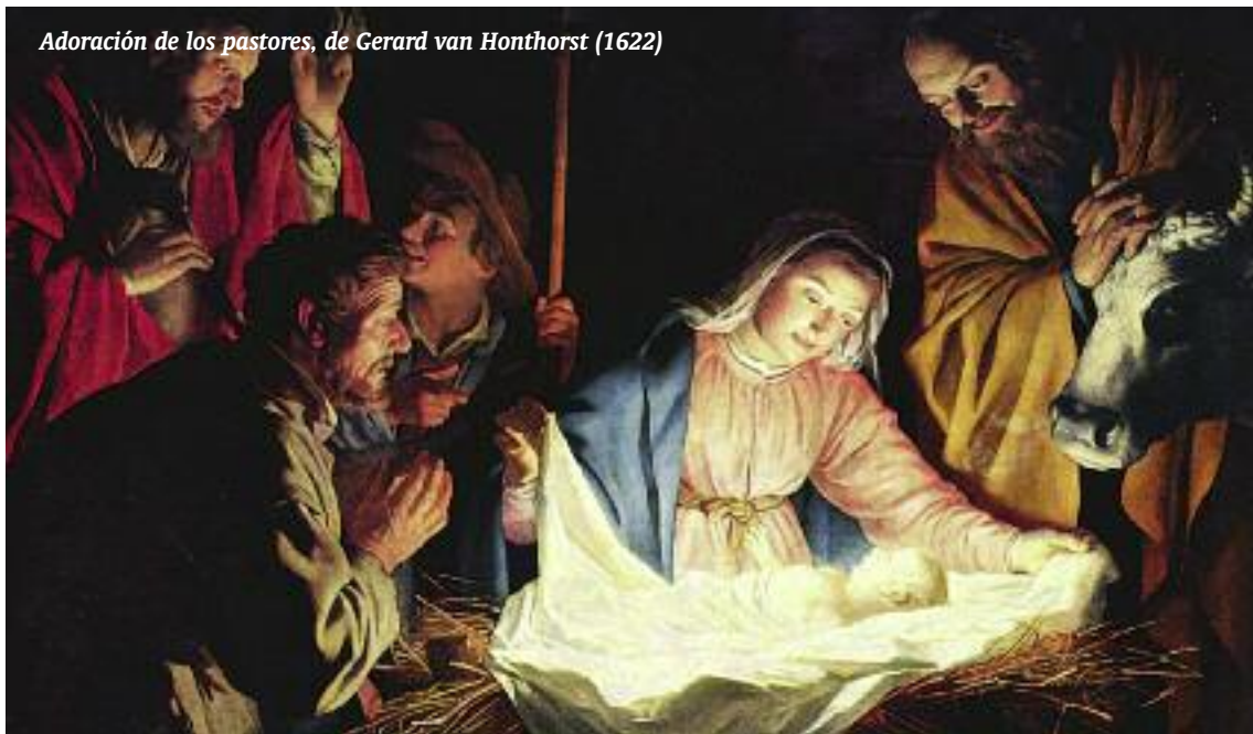
Adoración de los pastores, de Gerard van Honthorst (1622)