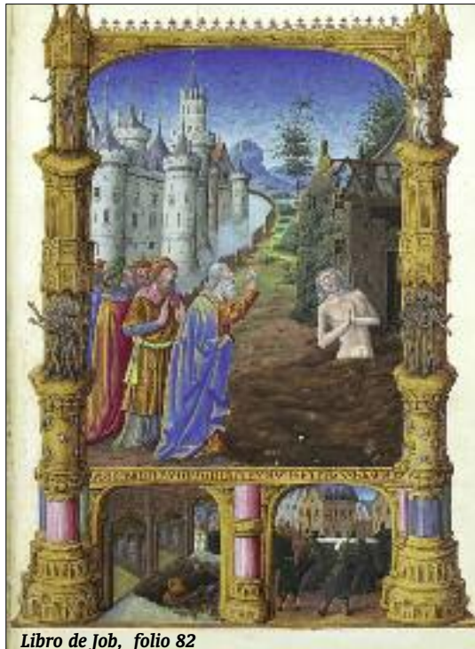
Libro de Job, folio 82

Como hemos dicho, lo que se describe está basado muy probablemente en una mezcla de fenómenos naturales, que incluiría al menos una erupción volcánica y una tormenta. Además, el relato probablemente esté entreverado con la liturgia del Templo de Jerusalén, donde el sonido de las trompetas y el humo del incienso podían inducir en el fiel un sentimiento o una sensación de «temor sagrado». En todo caso, lo que el creyente descubre en el relato es la presencia tremenda y fascinante de Dios, los dos rasgos que, según el teólogo y erudito alemán Rudolf Otto, caracterizan «lo Santo».