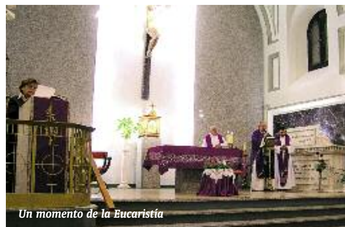
Un momento de la Eucaristía

Igualmente, se presentaron los cuadernos que la Fundación ha editado, para conseguir fondos y que están a la venta por 5.-€ y que son ideales para regalar en estas fechas. Puedes verlos en la pág. 8.