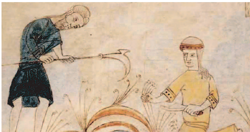
Adán y Eva trabajando la tierra en la Biblia del monasterio de Ripoll. CC

El relato de Gn 2 comienza con la presentación de una situación desoladora: no hay vida en la tierra porque no ha llovido ni hay nadie que la cultive. Como se puede apreciar, no se trata de una perspectiva cósmica, como en Gn 1, sino la que podría tener un campesino israelita. A continuación se habla de un