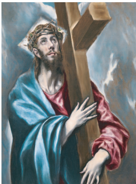
Cristo abrazado a la Cruz, por El Greco (DP)

Hoy día se habla insistentemente de la necesidad de reformas: de la Constitución, de las estructuras económicas, del sistema electoral, de los partidos políticos, de la Curia. Esta cuaresma es el momento idóneo para reflexionar sobre cualquiera de ellas, empezando siempre por la conversión personal al Señor que nos quiere a todos. Por eso, Don Abundio nos recuerda que las reformas exigen más que nuevas leyes y estructuras: el cristiano ha de insistir en la reforma de la cabeza y del corazón convirtiéndose a su Dios. El texto que se ofrece a continuación forma parte de una plática dada por el Siervo de Dios en marzo de 1965. Subraya unos puntos centrales de la enseñanza de la Iglesia posconciliar.