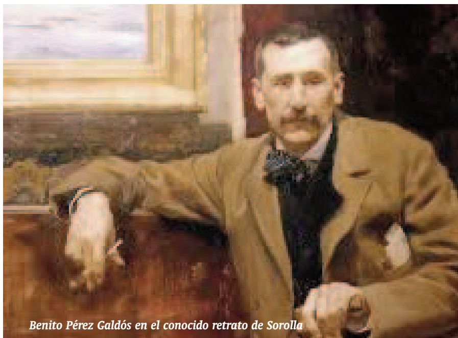
Benito Pérez Galdós en el conocido retrato de Sorolla

Escribió 77 novelas, 22 obras de teatro. Es uno de los grandes escritores en lengua española. El mundo galdosiano abarca la vida española en su totalidad, concentrada en Madrid