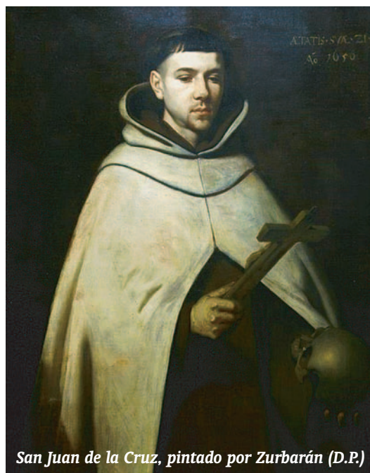
San Juan de la Cruz, pintado por Zurbarán (D.P.)

En las estrofas siguientes el alma, en busca del Amado, avanza como una flecha hacia el blanco, y se vuelve hacia la belleza del sendero de la noche que la llevó. Cuando el alma llega a la unión, el gozo revertirá sobre la densa tiniebla guiadora, como lo hará sobre las criaturas en el Cántico .